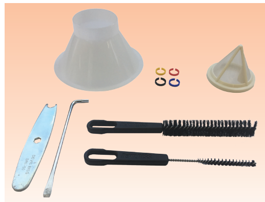
Zestaw pistoletu zawiera: pistolet z wybraną głowicą, dyszą i iglicą, kubek opadowy, filtr wlewowy do farby, klucz płaski, klucz imbusowy i szczoteczki do czyszczenia.

Kolejne informacje są dostępne w dokumentacji techniczno ruchowej pistoletów DeVilbiss SRI Pro Lite.